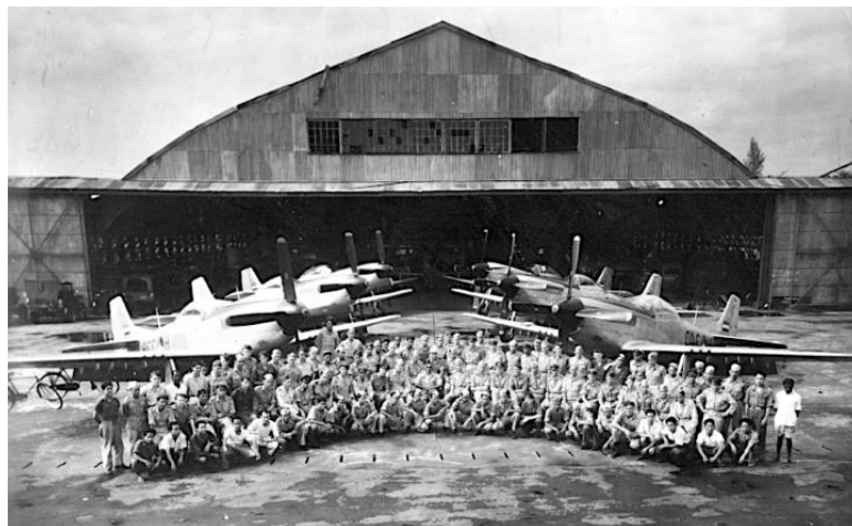
Laatste “staatsieportret” 122 squadron en 6 P51's - begin 1950