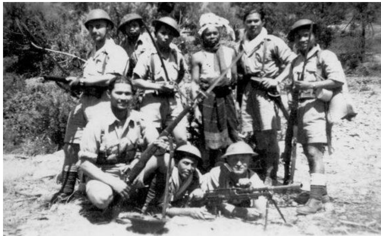
Guerrillastrijders op Timor

Vervolgens heeft mijn vader deelgenomen aan de guerrillastrijd die voornamelijk plaatsvond op Portugees Timor.