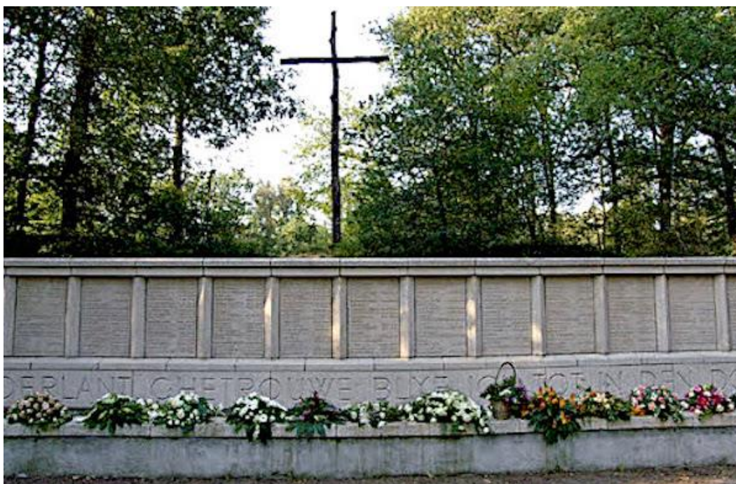
Herdenkingsmonument op de Fusilladeplaats van Kamp Vught